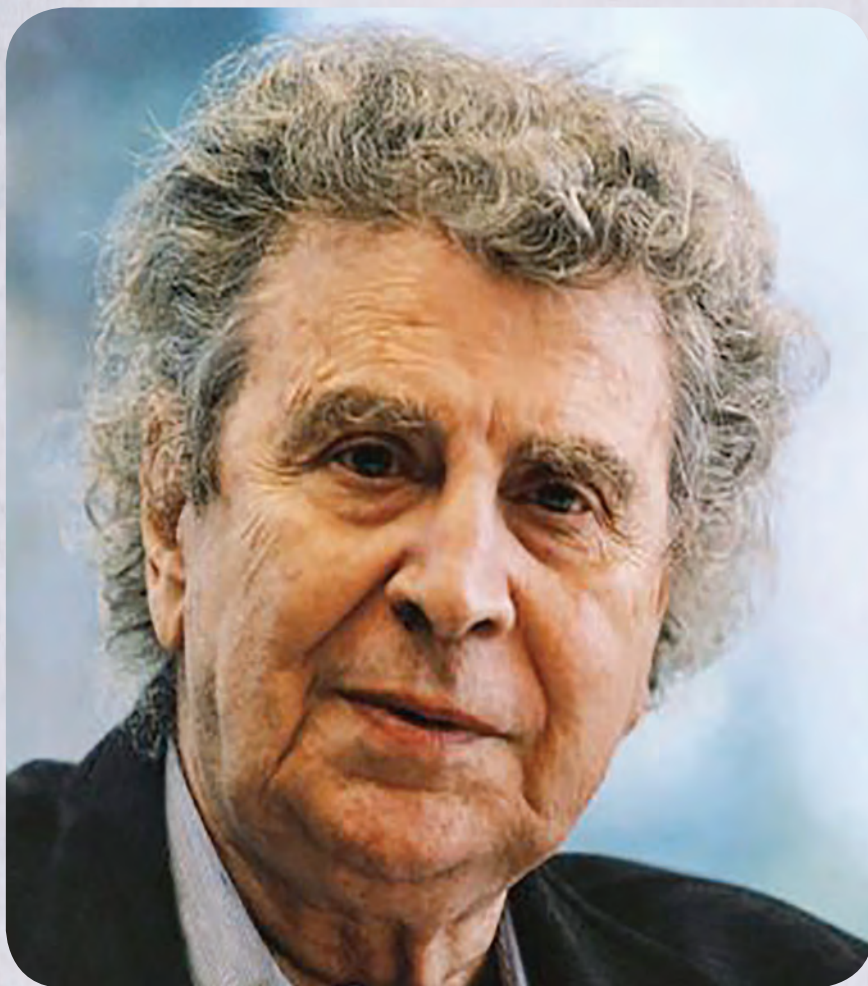
Μίκης Θεοδωράκης (Χίος, 29 Ιουλίου 1925 - Αθήνα, 2 Σεπτεμβρίου 2021)