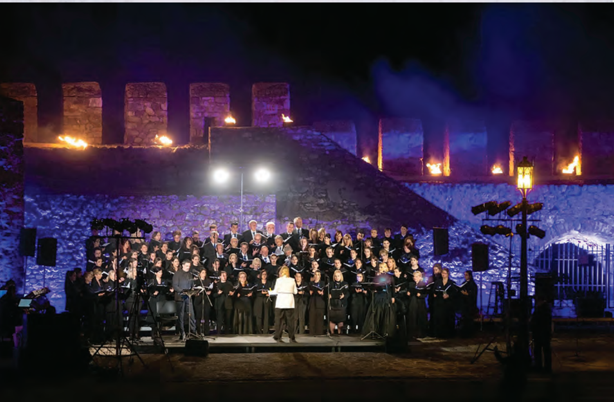
Μεγάλη Παρασκευή - Ναύπακτος 2023, Ενεπικό Λιμάνι